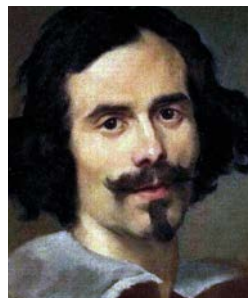
Gian Lorenzo Bernini (1598 – 1680)