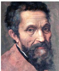
Michelangelo Buonarroti (1475 – 1564)

Secondo la tradizione, lo spettacolo della Girandola venne originariamente ideato da Michelangelo Buonarroti e perfezionato un secolo più tardi da Gian Lorenzo Bernini. Li conosci bene? Completa la tabella con le informazioni corrette!